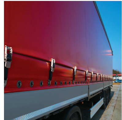
Truck tarpaulin